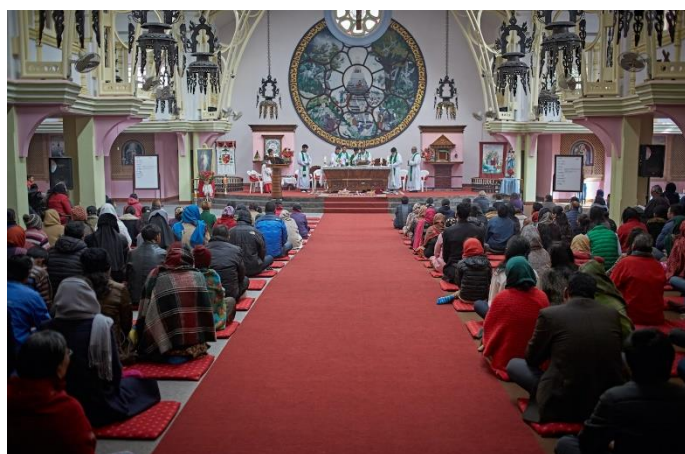
Thánh lễ tại Nhà thờ chính tòa Đức Mẹ Mông Triệu Thăng Thiên, Kathmandu.