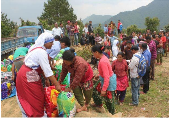
Một nữ tu Dòng Thừa Sai Bác Ái đang giúp phân phát hàng cứu trợ ở vùng núi bao quanh Thung lũng Kathmandu, sau trận động đất năm 2015.

đang phục vụ rất tốt, đặc biệt thông qua 37 trường học (trong đó có một trường cao đẳng, 18 trường trung học và hai trường kỹ thuật), đào tạo hơn 30.000 học sinh; Caritas Nepal; và các chương trình phúc lợi xã hội cho người nghèo già cả và người mắc bệnh tâm thần.